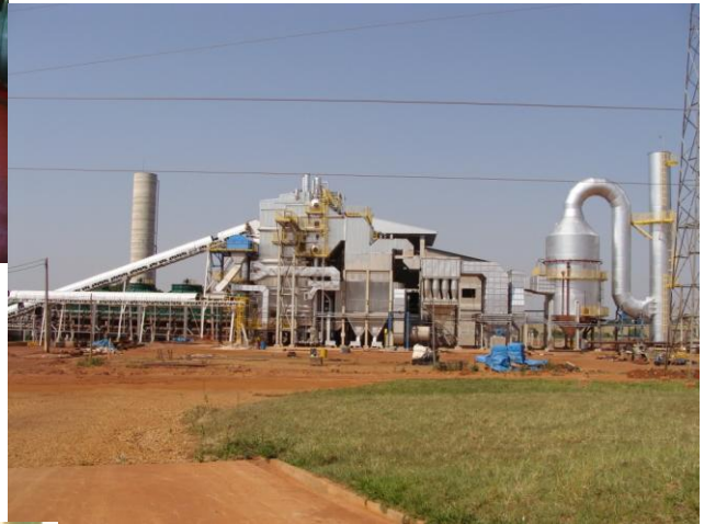
Prática de Termelétrica em Construção