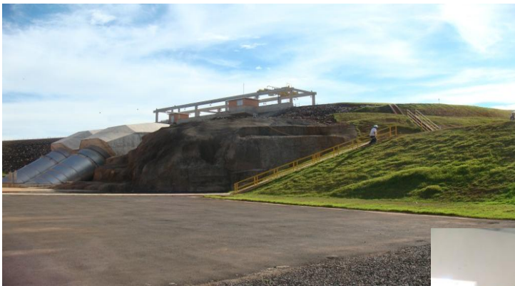
Câmara de Carga e Conduto Forçado