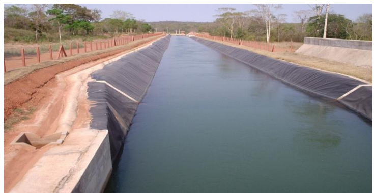
Canal de Adução