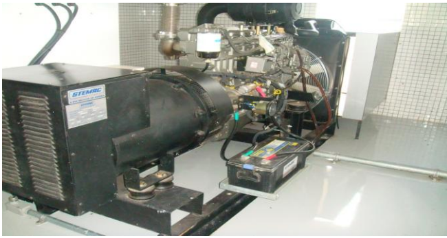
Gerador Diesel – Sistema No Break