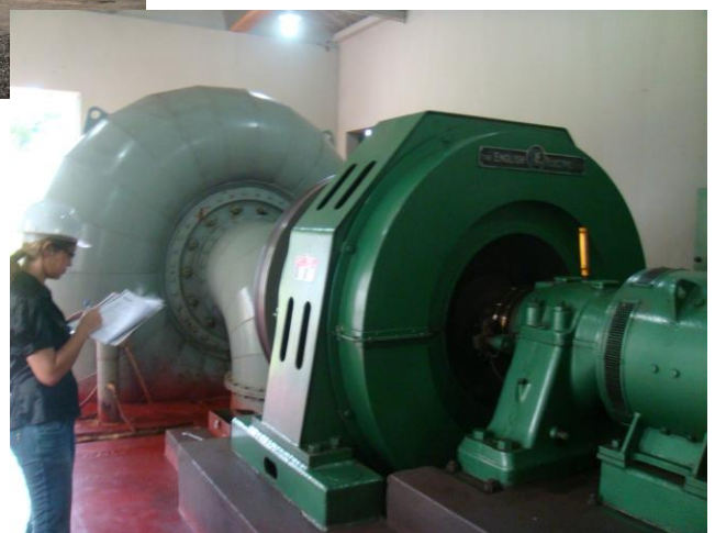
Turbina e Gerador Hidráulico