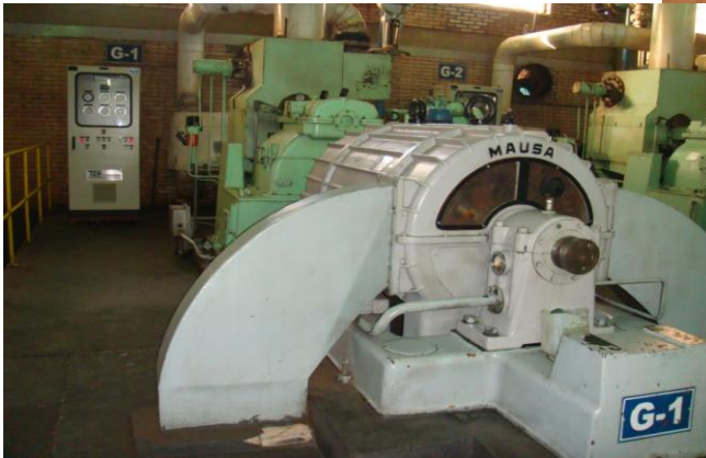
Turbina e Gerador Termelétrico