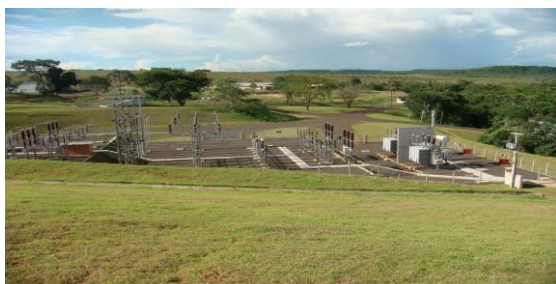
Vista Panorâmica de Subestação de Elevação