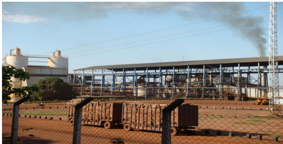
Vista Panorâmica de Termelétrica em Operação