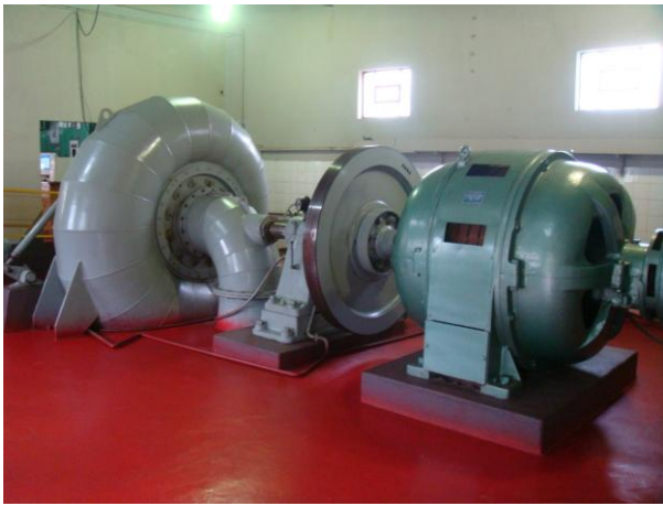
Turbina e Gerador Hidráulico